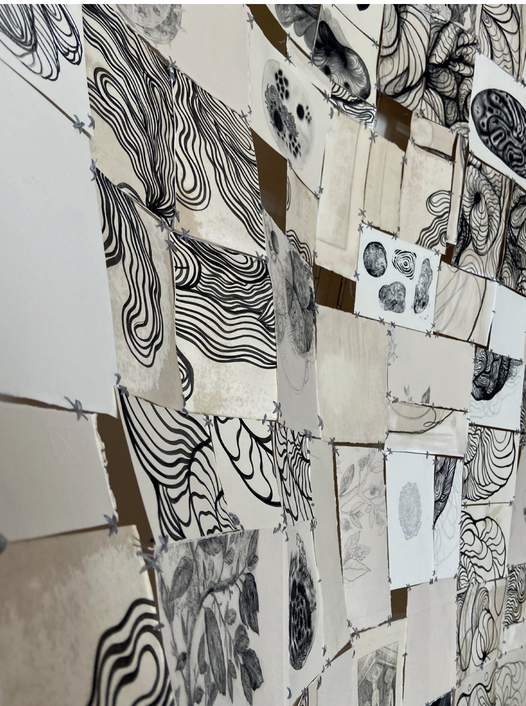
(ти) между фрагментите. детайл