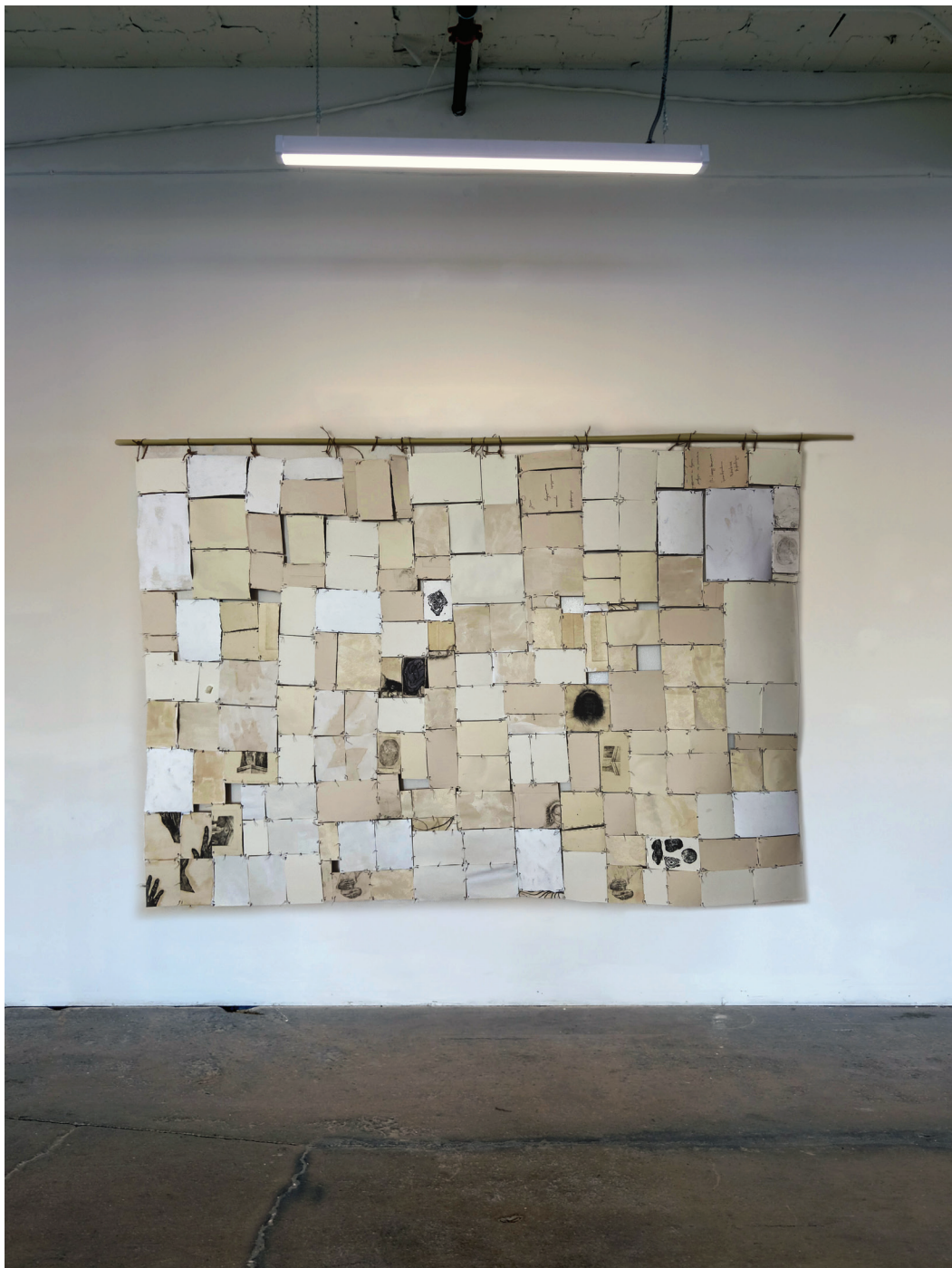
(ти) между фрагментите. Поглед към инсталацията отзад.