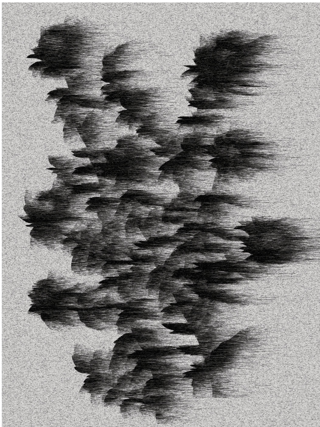
Безцветен мотив 3