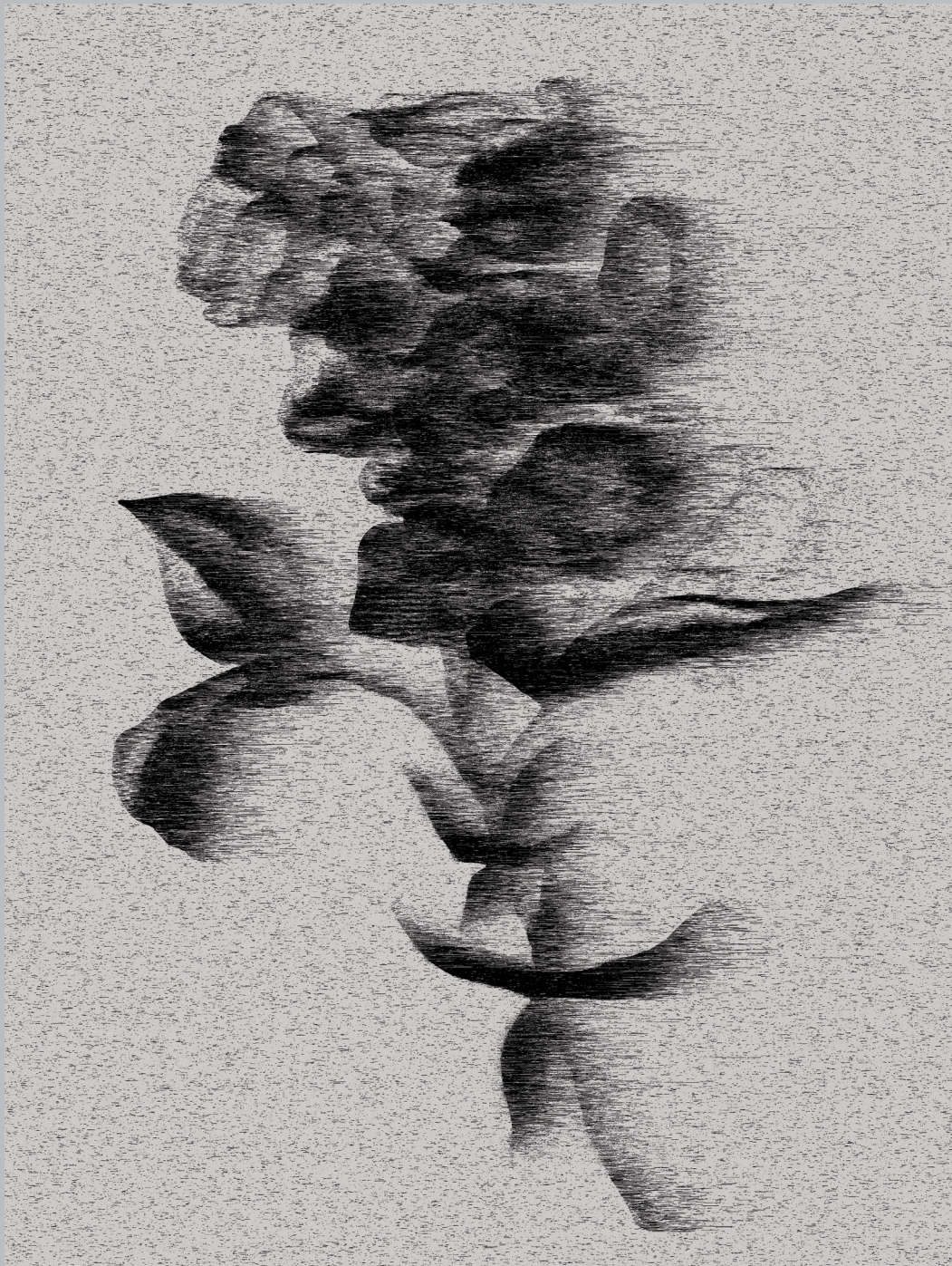
Безцветен мотив 1