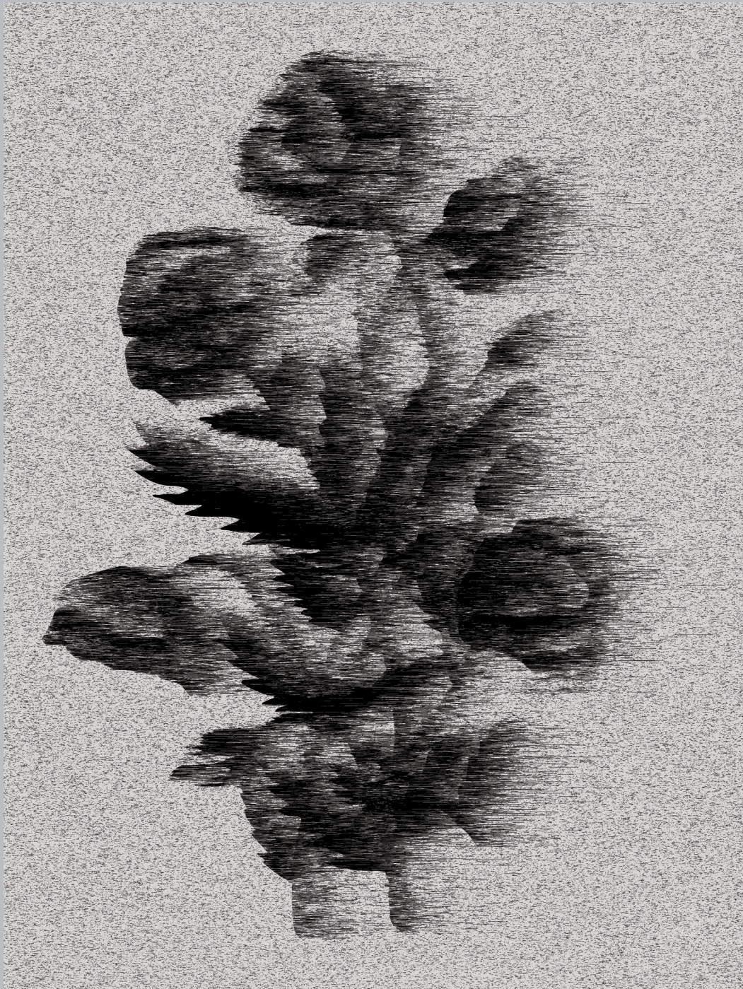
Безцветен мотив 2