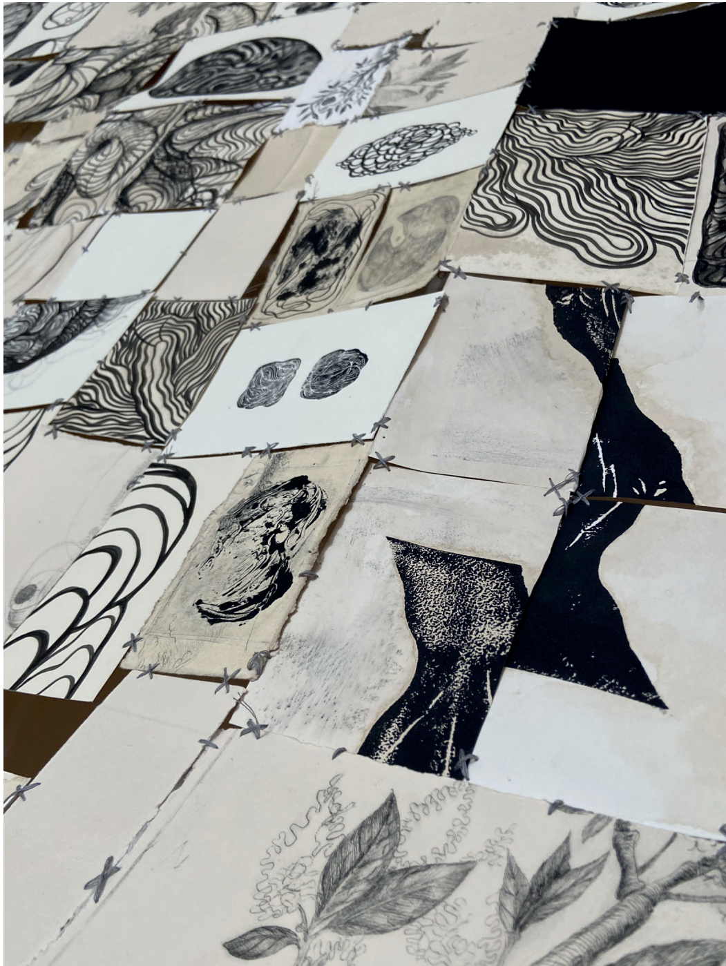
(ти) между фрагментите. детайл