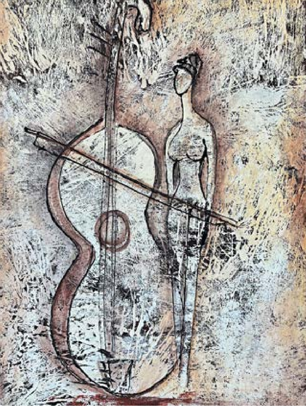
„Музата идва внезапно“ – масло върху платно 50x70 см