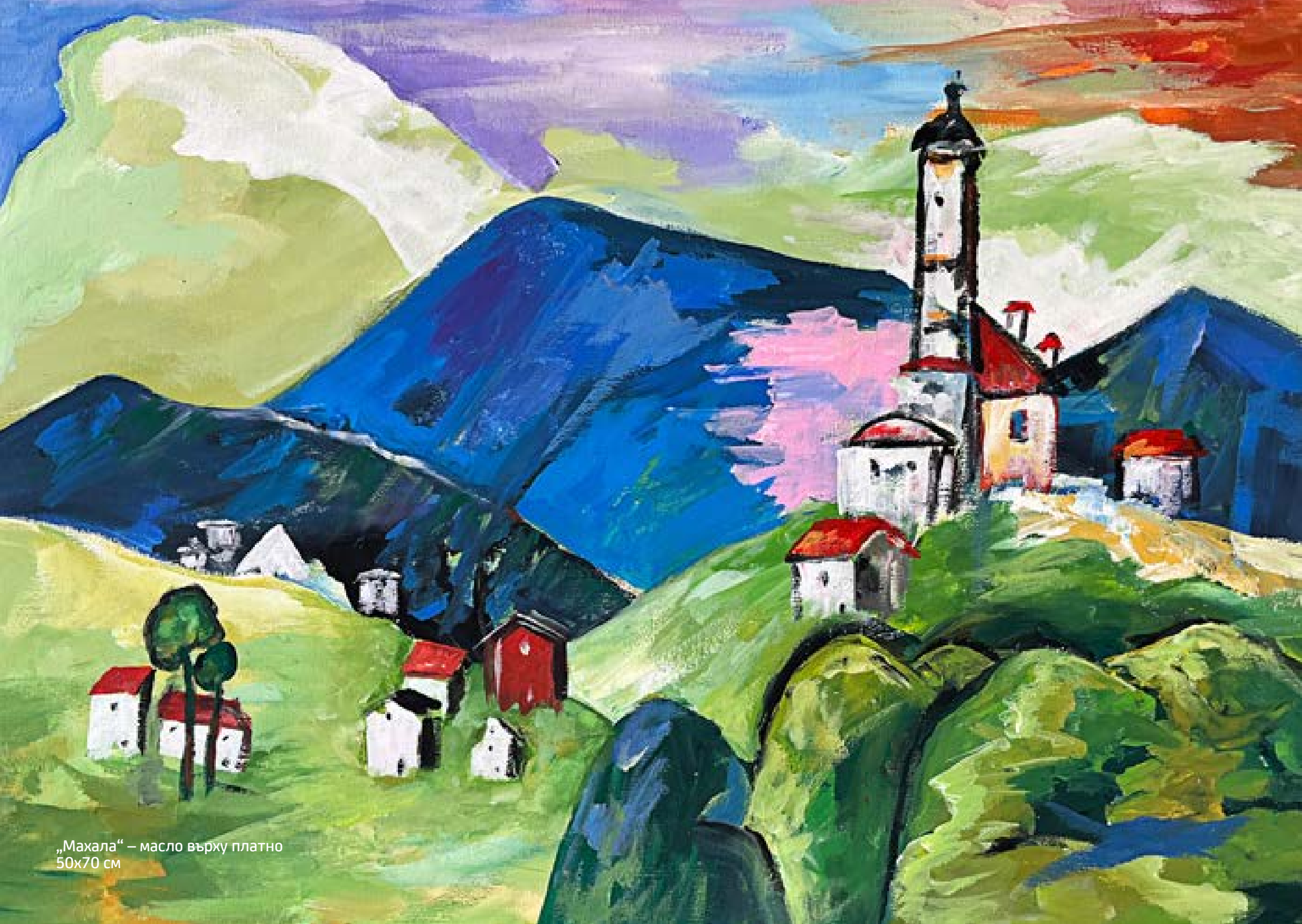
„Махала“ – масло върху платно 50x70 см