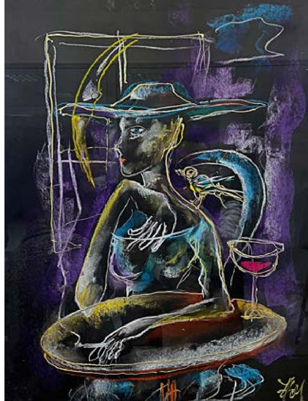
„Пилето на късмета“ – пастел 50x70 см