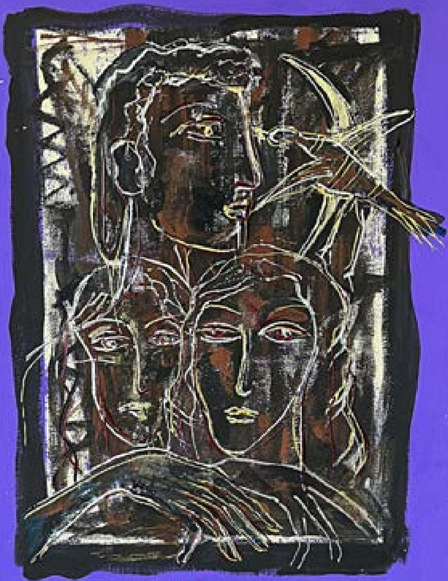
„Житотът, това са две жени – по едноименната пиеса на Стефан Цанев“ – масло върху платно 50x70 см