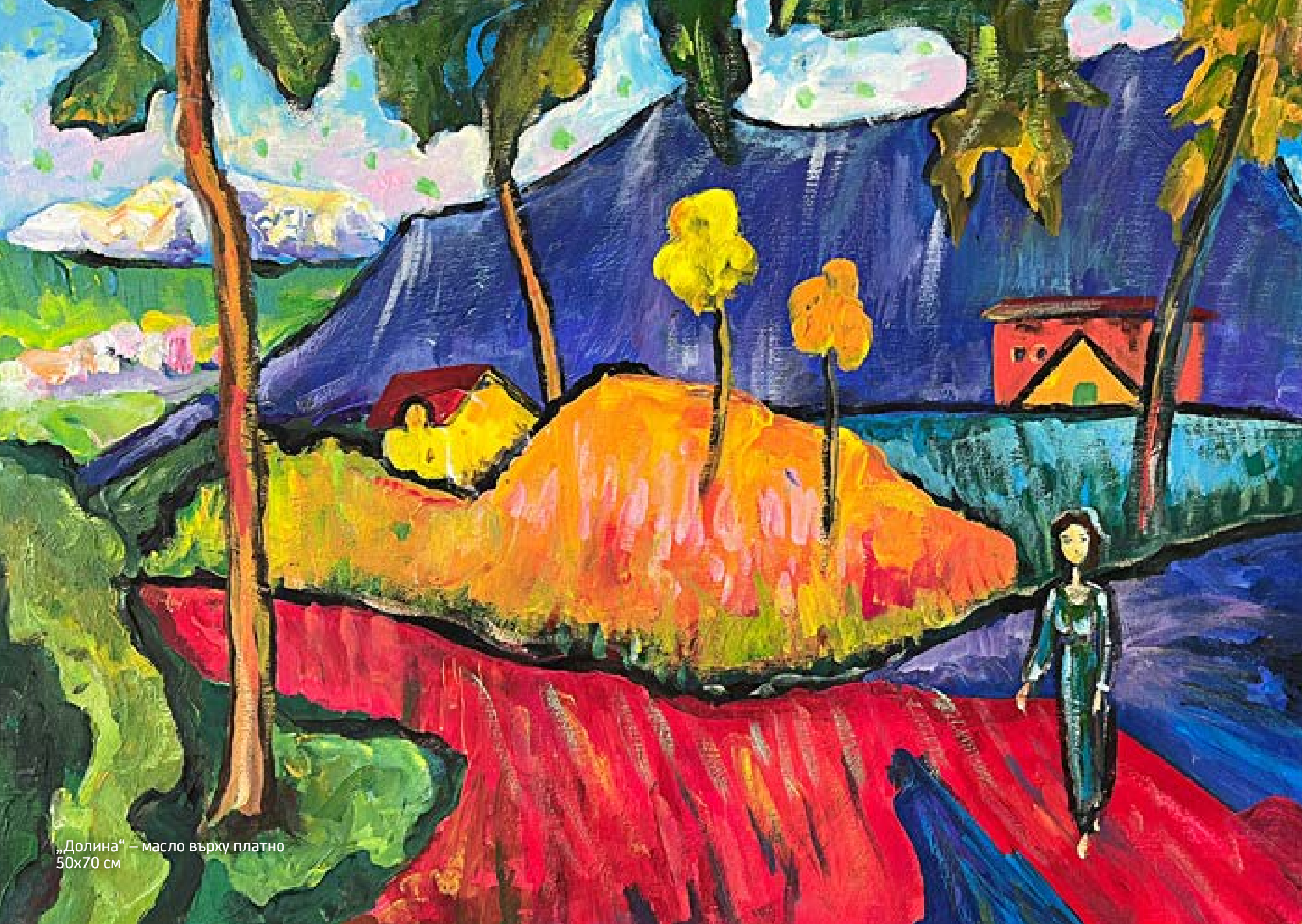
„Долина“ – масло върху платно 50x70 см