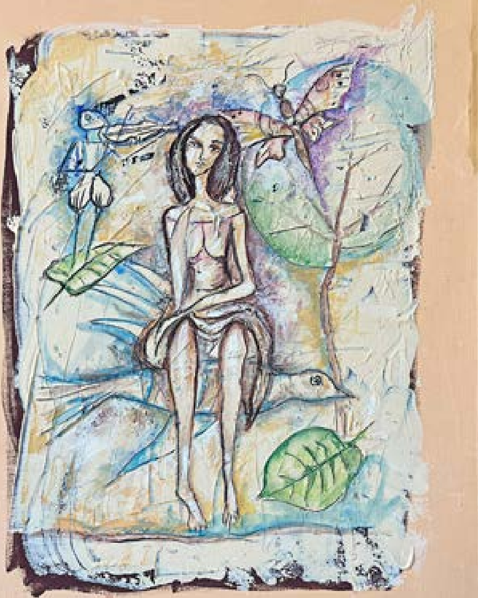
„Серенада“ – масло върху платно 50x70 см