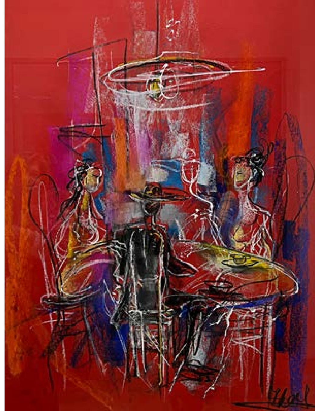
„Игра на покер“ – пастел 50x70 см