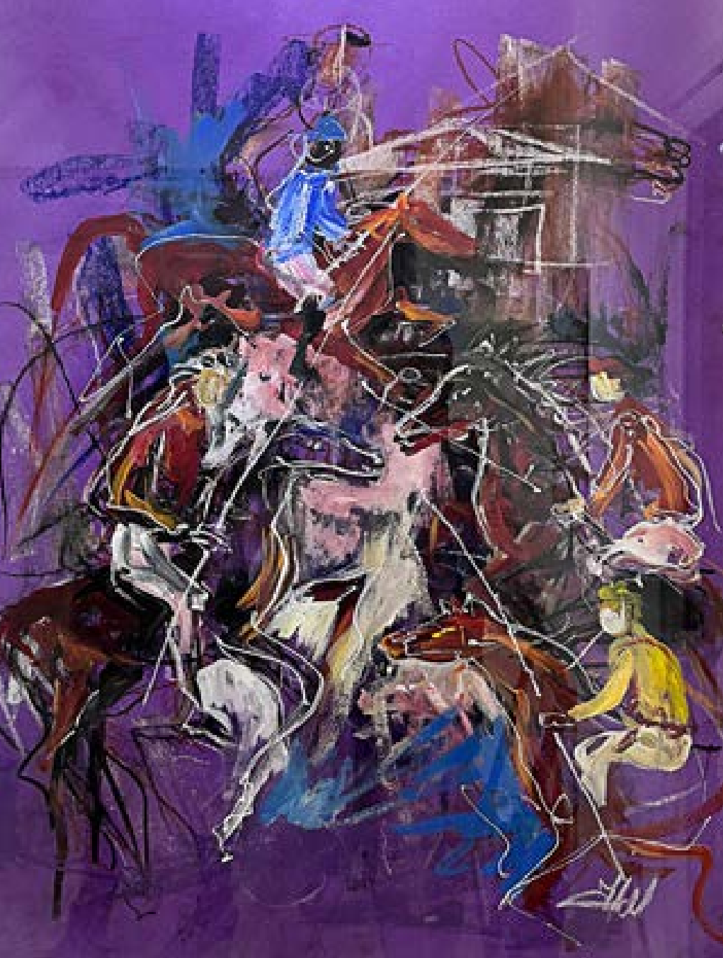
„Утре могат да умрат и без война, и без дуел“ – пастел 50x70 см