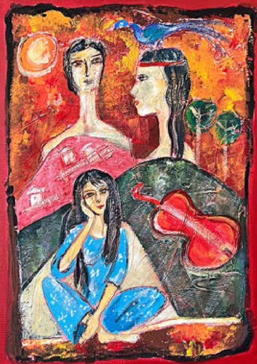
„Таборът отива към небето“ – масло върху платно 50x70 см