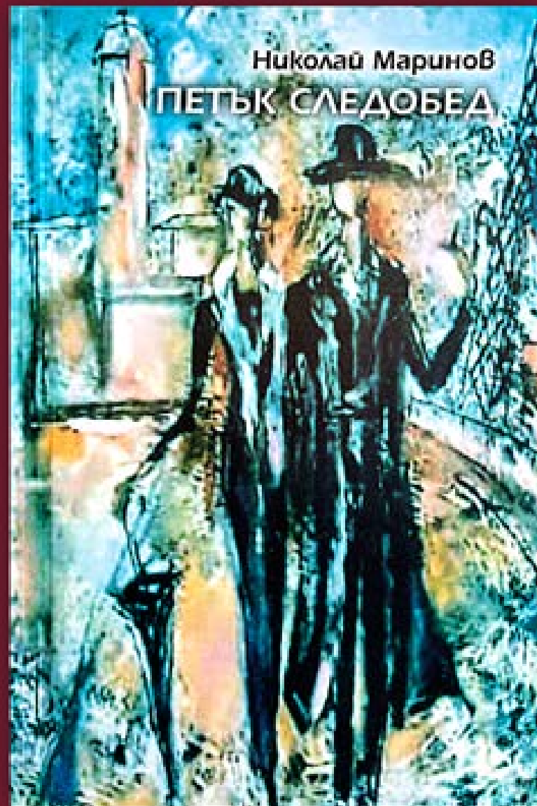
Стихосбирка – „Петък следобед“ – масло върху платно 50x70 см