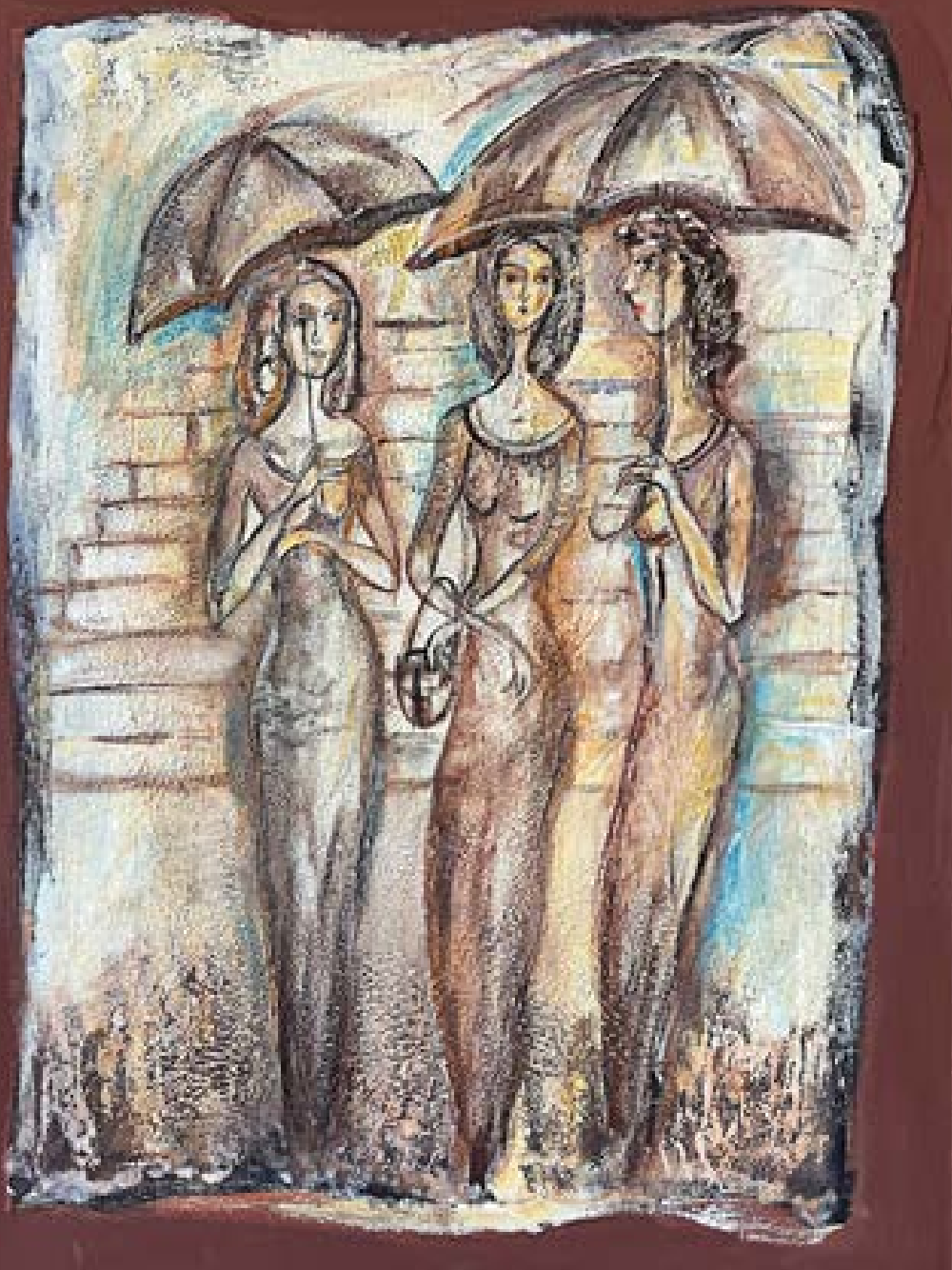
„Грации под дъжда“ – масло върху платно 50x70 см