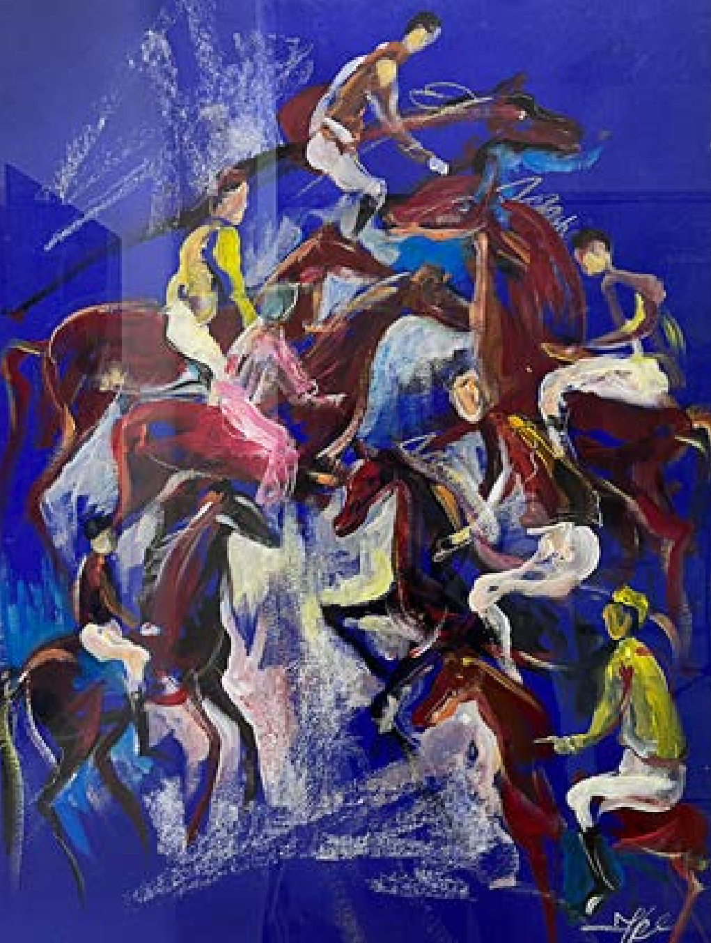
„Крадци на коне“ – пастел 50x70 см