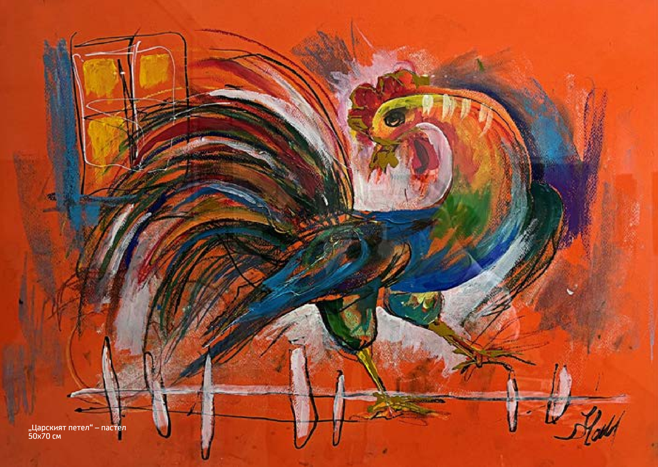
„Царският петел“ – пастел 50x70 см