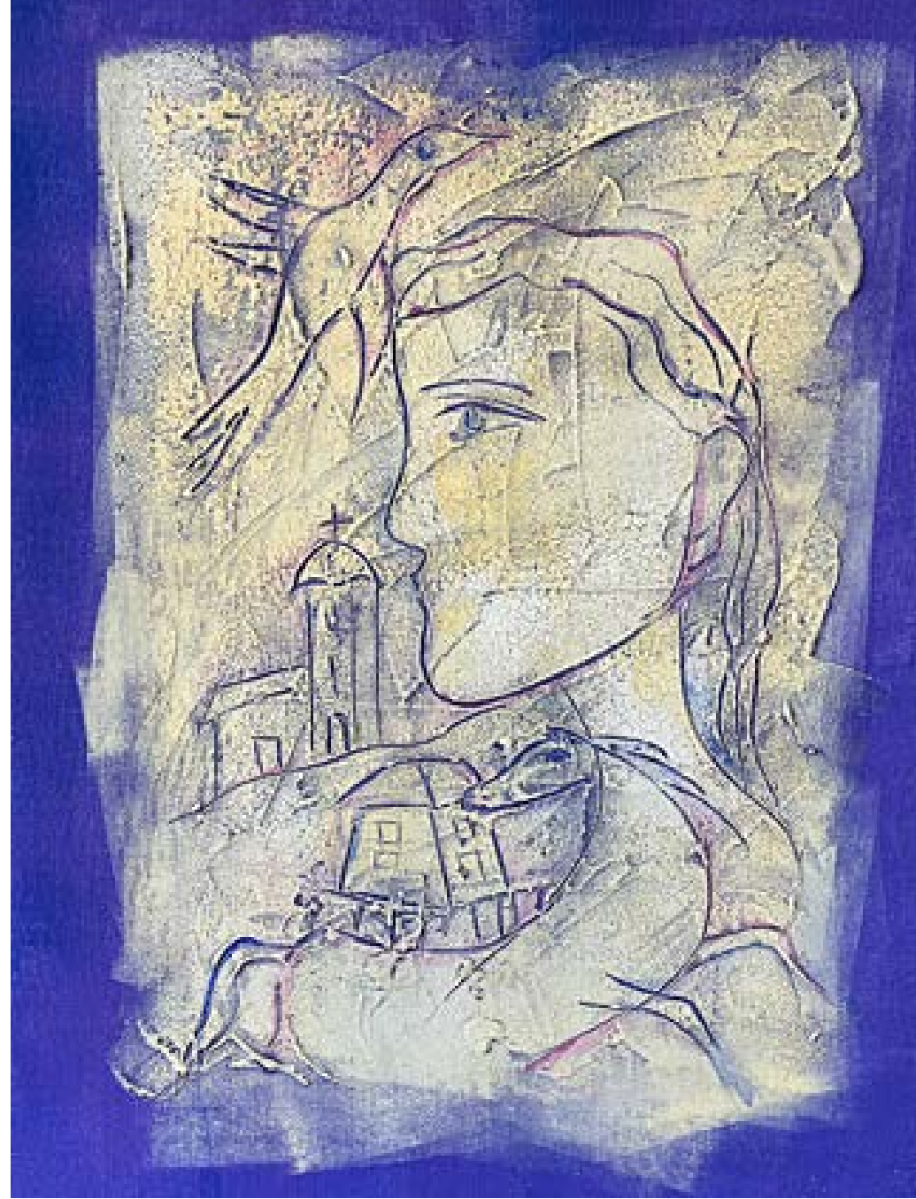
„Романтично“ – масло върху платно 50x70 см