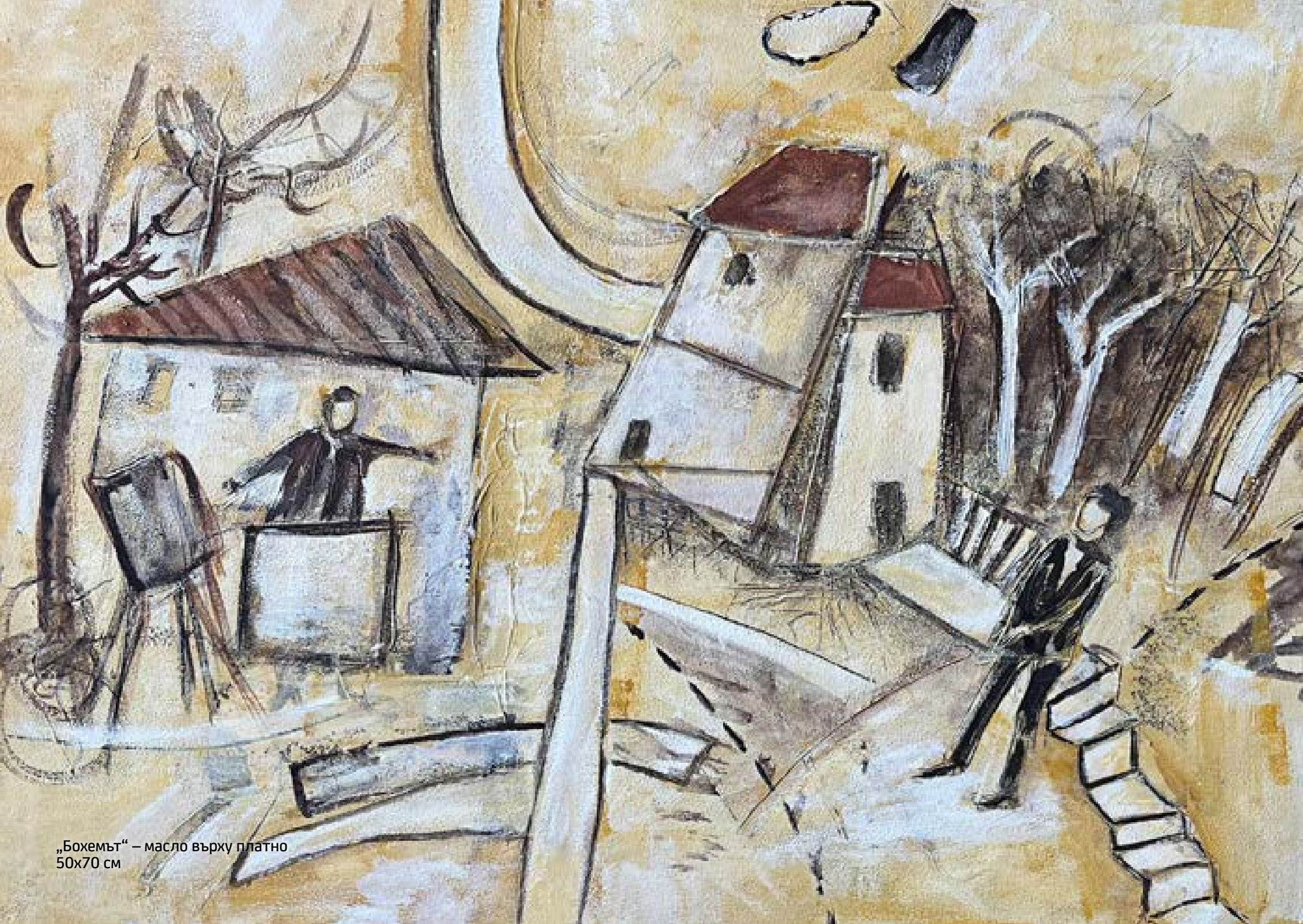
„Бохемът“ – масло върху платно 50x70 см