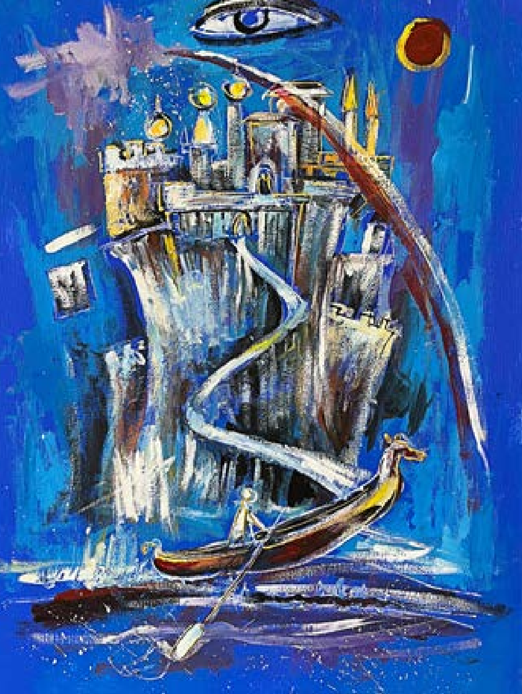
„Дългият път“ – масло върху платно 50x70 см