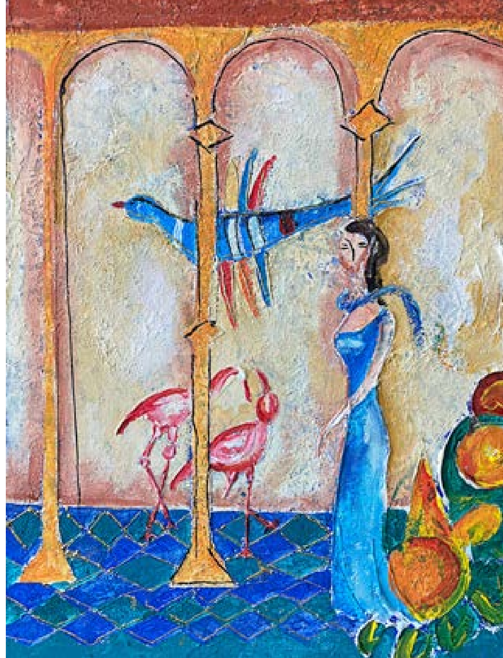
„Две сини птици“ – масло върху платно 50x70 см