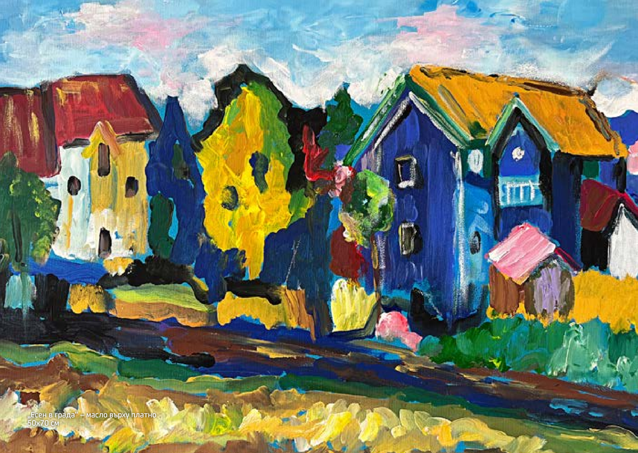
„Есен в града“ – масло върху платно 50x70 см